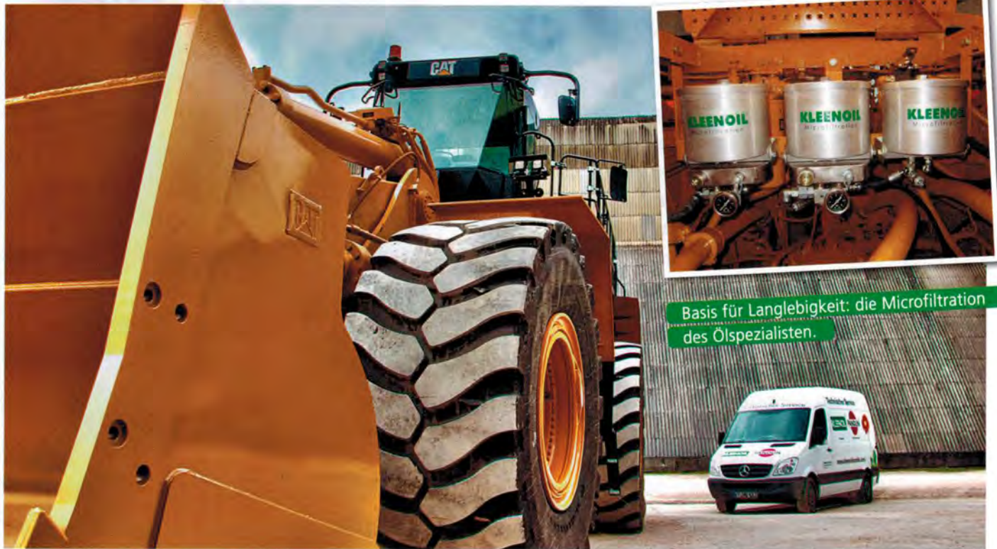
Basis für Langlebigkeit: die Microfiltration des Ölspezialisten.